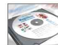
CD-ROM educacional interativo