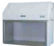
Capelas de Fluxo Laminar