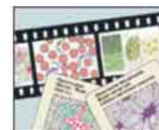
Fotografias em slides coloridos de 35mm