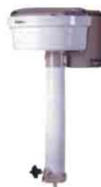
Destiladores de água