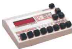
Contadores de Células