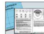
Manual com textos e desenhos