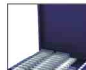
Lâminas preparadas para microscopia