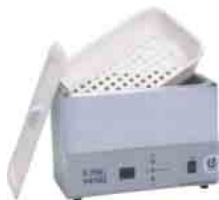
Banhos de Ultrassom