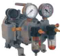
Bombas de vácuo