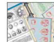
Programa multimídia para biologia microscópica