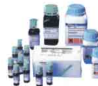
Reagentes das melhores marcas