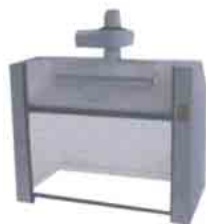
Capelas de Exaustão