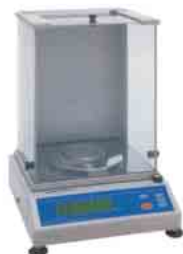
Balanças Analíticas e Semi-analíticas