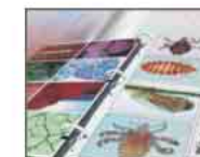
Transparências para retroprojetores