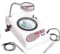
Contadores de Colônias